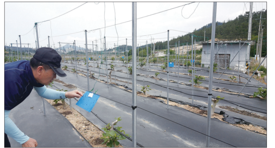
영암군, 지역특화과수 무화과 본격 영농 기술지원

영암군은 무화과의 고품질 안정생산을 위하여 본격적 현장 영농기술지원에 나서고 있다. 군에 따르면 영암군 무화과재배는 765농가 430ha에 이르고 있으며 올해는 평년에 비해 겨울철 날씨가 따뜻하여 발아일이 4~5일 이를 것으로 예상된다.