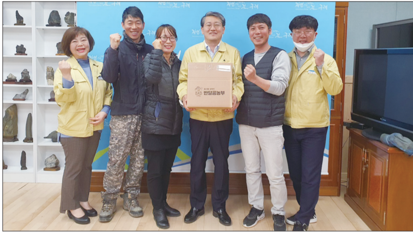
구례군 청년창업농, 취약계층 지원 농특산물 기탁